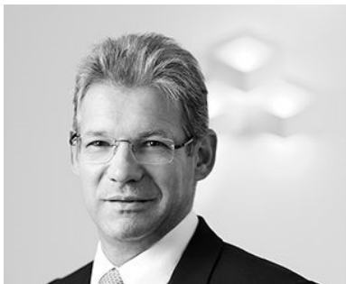
Directeur Général Administrateur