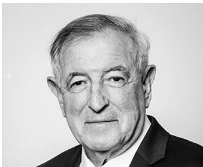
Président du Conseil d'Administration Administrateur indépendant Membre du Comité Stratégique et des Investissements