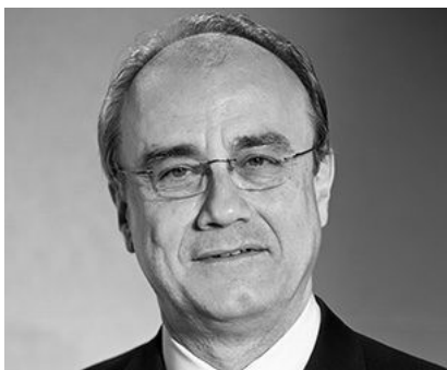
Administrateur indépendant Membre du Comité d'Audit Président du Comité des Rémunérations et des Nominations