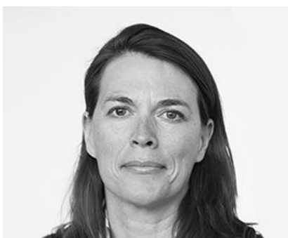
Administrateur indépendant Membre du Comité d'Audit