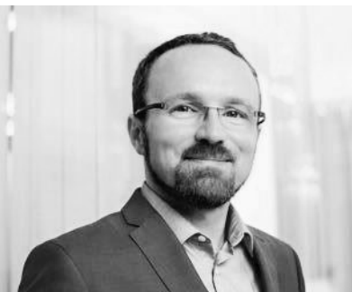
Directeur Général Délégué