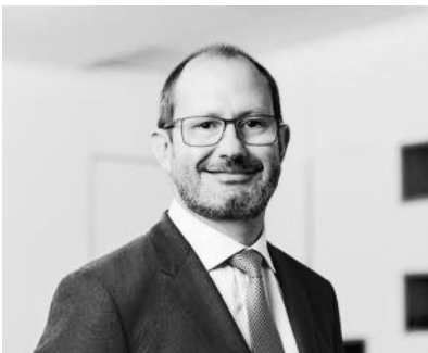
Directeur Général Délégué